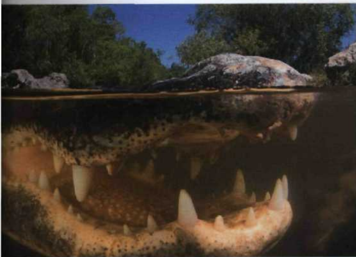
he, Schlangen und Drachen 126