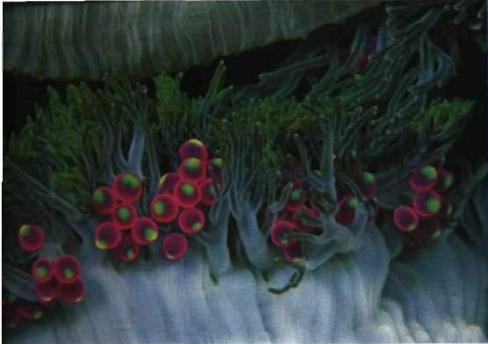
gewöhnliche Meereswesen 16