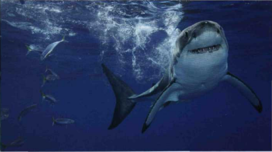
2 Fantastische Fische 46