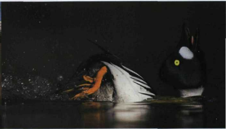
6 Geniale Vögel 156