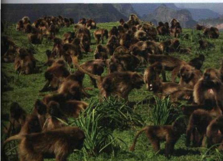
Intelligente Primaten 262