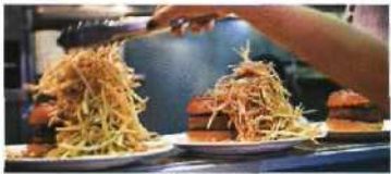
Restaurant: The Spotted Pig 314 W. 11th St, West Village Tel: 001 212 6200393 Seite 30