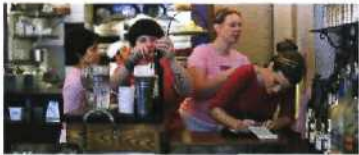
Restaurant: Prune 54 E. 1st St, East Village Tel: 001 212 6776221 Seite 20