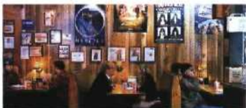
Restaurant: Burger Joint 119 W. 56th St, Midtown Tel: 001 212 7087414 Seite 44