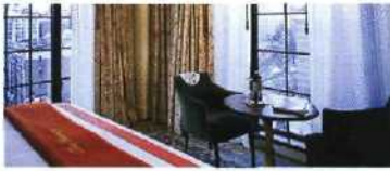
Hotel: The Bowery 335 Bowery, East Village Tel: 001 212 5051300 Seite 8