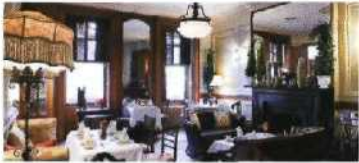
Hotel: Inn at Irving Place 56 Irving Place, Gramercy Tel: 001 212 5334600 Seite 14