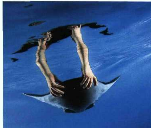
76 Bio-Effizienzforschung: Von Rochen lernen, wie die Natur »denkt«.