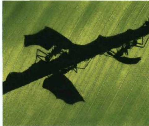
10 Natur als Vorbild: Blattschneiderameisen beim Blättertransport.