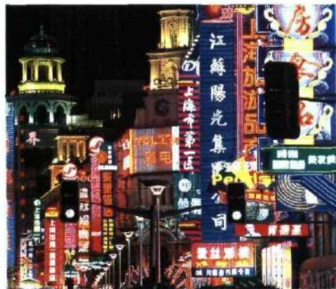
188 Eine Stadt erfindet sich neu: Abend in der Nanjing Road, Shanghai.