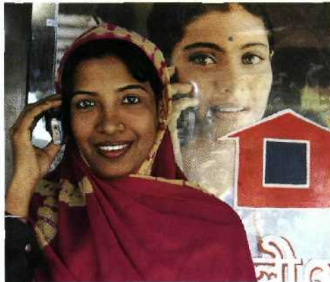
118 Handys auf Mikrokredit: In Bangla- desch eine Geschäftsgrundlage.