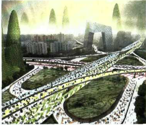
34 Herausforderung der Zukunft: Mobilität und Individualität vereinen.