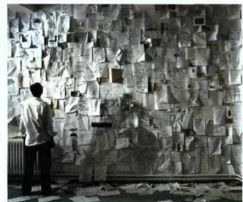
168 Nur wer fragt, kann im Chaos der Möglichkeiten Ordnung schaffen.