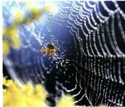
132 Der Naturwerkstoff Spinnenseide steht im Fokus von Biotechnologen.