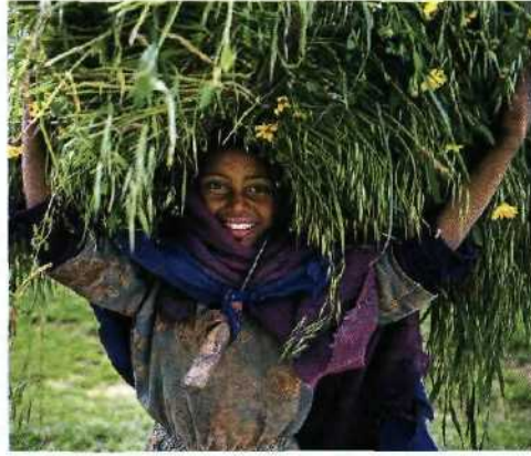
56 Wer den Welthunger bekämpfen will, muss den Kleinbauern helfen.