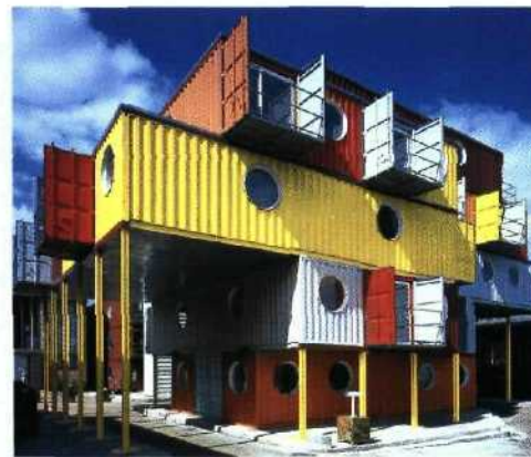
210 Docklands, London: Wohn- und Büro- projekte in alten Frachtcontainern.

DBU: Intelligentes Rohstoffmanagement . . . 116