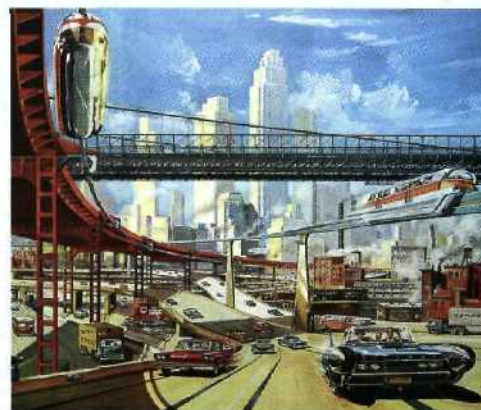
152 Utopien von gestern: Schöne neue Welt von morgen in bunten Bildern.