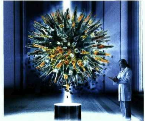
26 Faszinierend und lockend: Das Neue wartet darauf, entdeckt zu werden.