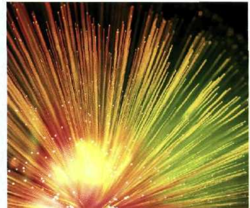
98 Licht-Botschaft in Glasfasern: Schneller und besser geht es nicht.