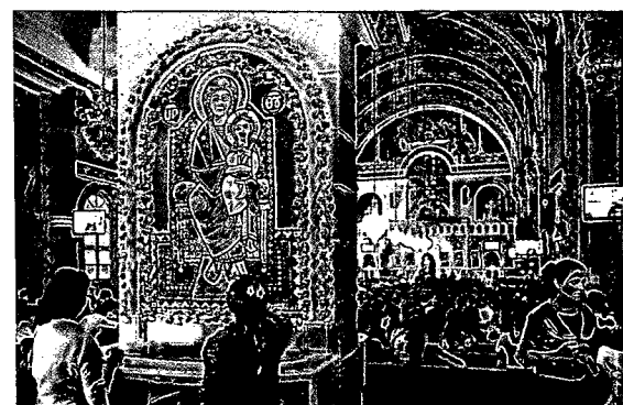
42 STARKER GLAUBE Selbstbewusst: die orthodoxen Kopten in der St.-Markus-Kathedrale in Alexandria