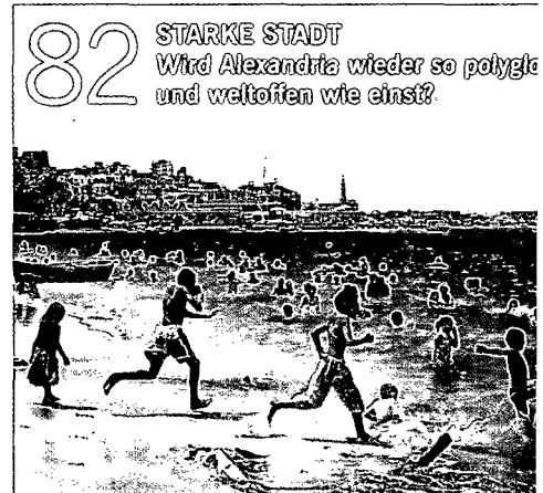
82 STARKE STADT Wird Alexandria wieder so polyglott und welttoffen wie einst?