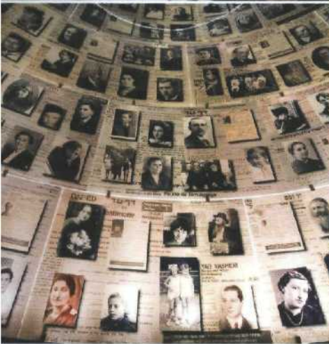
Doppelseite vorne: Blick über die Jerusalemer Altstadt mit den blauen Kuppeln der Grabeskirche; unterhalb der kleineren Kuppel liegen die Zellen der äthiopischen Mönche. Olivenhaine im galiläischen Frühling (oben). Ein orthodoxer Jude studiert den Talmud (Mitte). Die Halle der Namen in der Gedenkstätte Yad Vashem (unten).