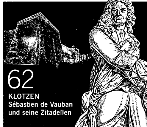
KLOTZEN Sébastien de Vauban und seine Zitadellen

Friedlich fließt die Saar durch die Hauptstadt, vorbei am barocken Hafenkran