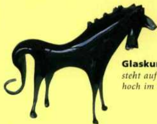
Glaskunst steht auf Mallorca hoch im Kurs.