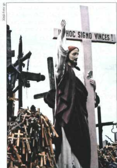
Am Berg der Kreuze bei Šiauliai