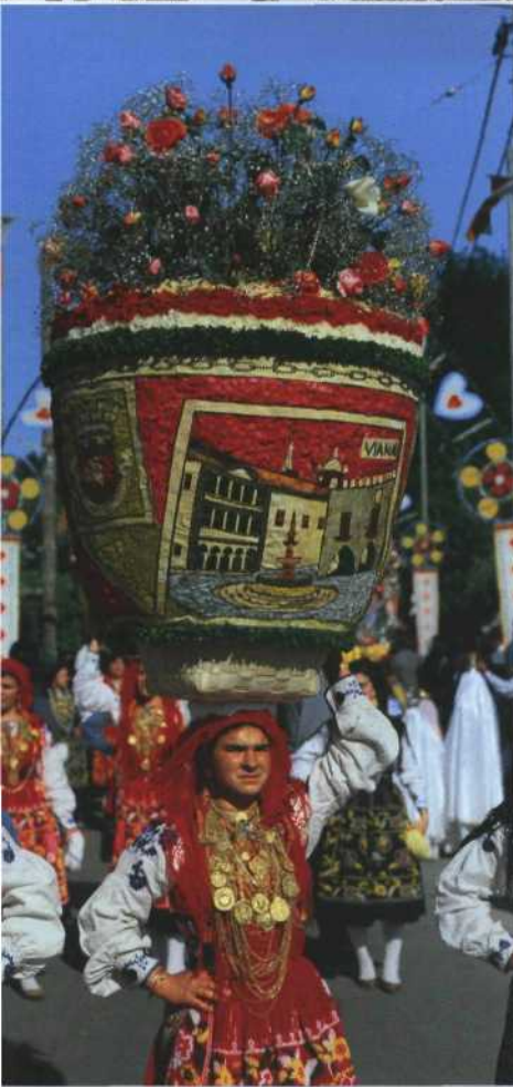
Der Treppenaufgang zur Wallfahrtskirche Bom Jesus do Monte nahe Braga (oben). Riesige Blumenarrangements sind ein häufig anzutreffender Augenschmaus bei der Festa das Rosas auf den Azoren (unten).