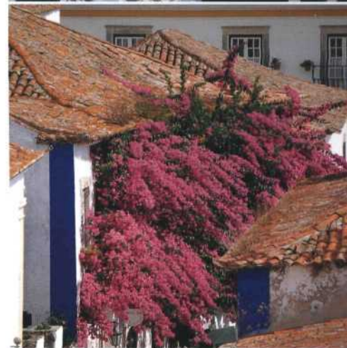
Innenansicht des Klosters Batalha (oben). Zur Festa de Santo António in Lissabon tragen auch junge Leute alte Trachten (Mitte). Bougainvilleen überranken die Dächer von Óbidos (unten).