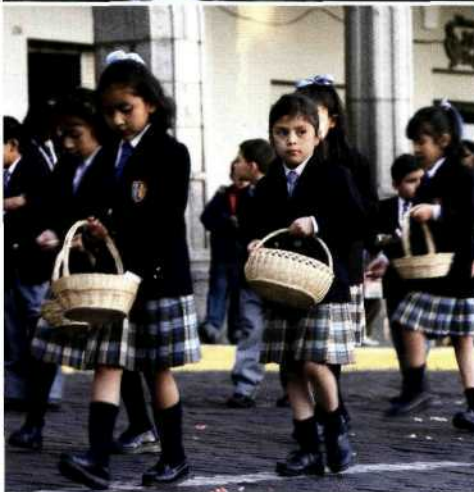
Mann in traditioneller Tracht und mit Panflöte (oben). Blühende Kakteen aus dem Hochland bei Abancay (Mitte). Prozession von Mädchen zu Ehren des Schutzheiligen von Arequipa (unten).