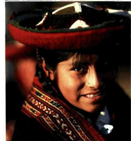
Verkaufsstand mit süßen Churros in Chachapoyas (oben). Bunt gewebte Stoffe in Chinchero (Mitte). Mädchen aus Chinchero (unten).