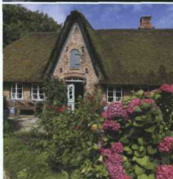
Oben: Die Filmhauskneipe in Ottensen Mitte: Fähranleger Blankenese Unten: Ausflug aufs nahe Sylt – friesische Reethäuser als Ausgleich zur hektischen Großstadt