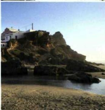
Oben: Mittelalterliches Aljezur. Mitte: Odeceixe an der Westküste ist ein besonders schönes Atlantik-Dorf. Unten: Die Klippen bei Praia de Monte Clérigo in der Abendsonne.