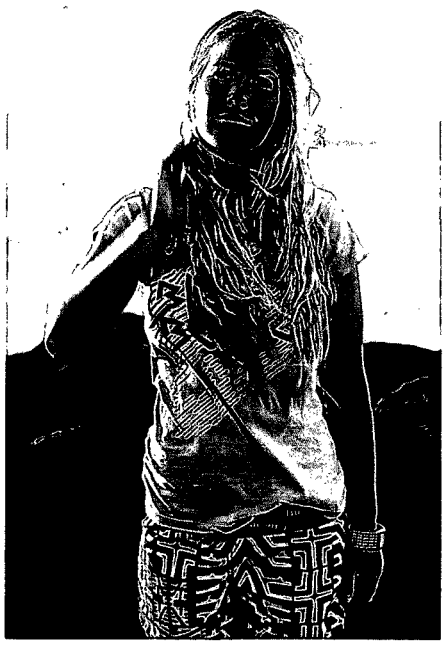
SIEGERTYPEN: Von sieben Insulanern, die es zu Ruhm gebracht haben: im Wellenreiten oder Marmeladen-Einkochen