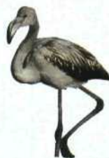
In den Teichen und Sümpfen Sardiniens überwintern Flamingos