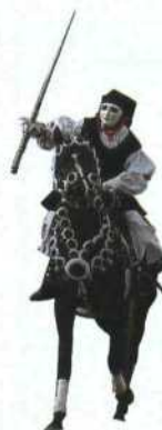
Ritter zu Pferd beim Sa-Sartiglia-Festival in Oristano (siehe S. 134)