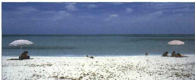
Strand bei Stintino (siehe S. 120) an der Spitze der Westküste