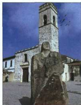
Museumsdorf San Sperate: berühmt für seine Skulpturen (siehe S. 62)