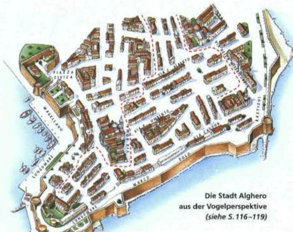
Die Stadt Alghero aus der Vogelperspektive (siehe S. 116–119)

Straßenkarte Hintere Umschlaginnenseiten