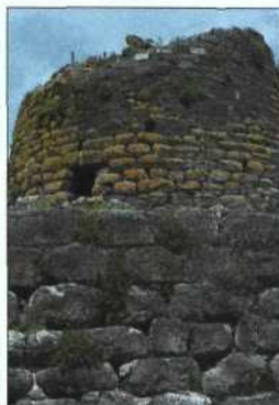
Prähistorischer Turm der Nuraghe Santu Antine bei Torralba