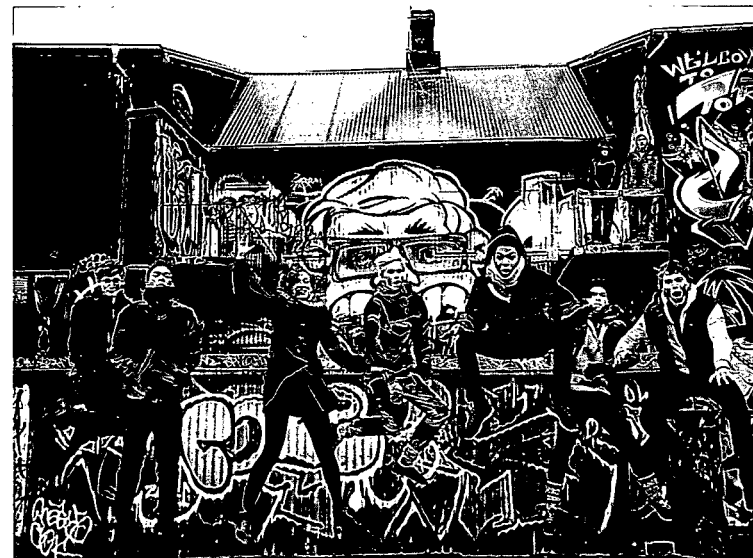
26 WILDE SZENE: Reykjavik und seine Bands – eine Erfolgsstory