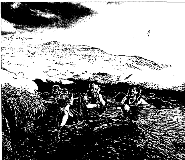
48 POOL-PARTY: Wo Isländer am liebsten planschen

74 FEINKOST: Islands neue Köche mögen es frisch und bunt