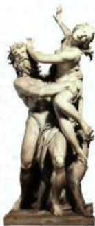
Berninis »Raub der Proserpina«