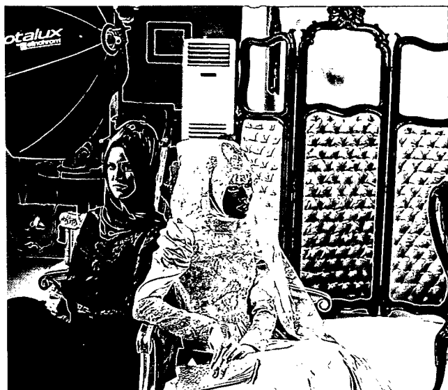
100 MONDÄN: Das Kopftuch als Trend-Accessoire

TITEL: CLAUDIUS SCHULZE, HAGIA SOPHIA REDAKTIONSSCHLUSS: 18. SEPTEMBER 2012