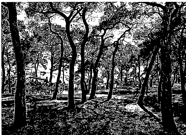
108 PARADIESISCH: Wo sich die Städter vom Stress erholen