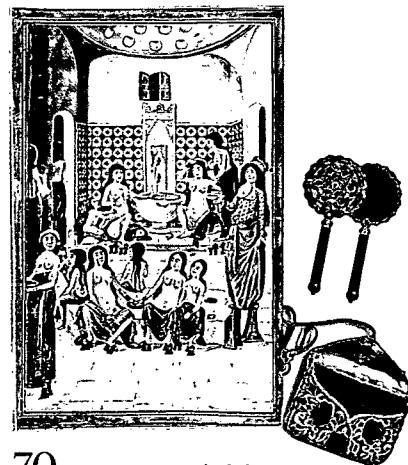
70 VERSTECKT: Wie lebten Haremsdamen im goldenen Käfig?