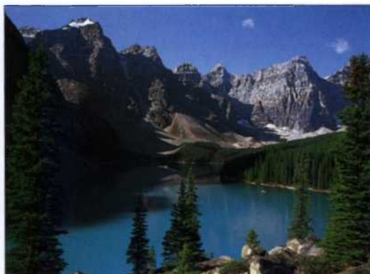
Lake Moraine im Banff National Park (siehe S. 300–303) in den Rockies