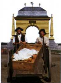
Rekonstruierte Vergangenheit: Fortress Louisbourg (siehe S. 96f)

New Brunswick, Prince Edward Island und Nova Scotia 74