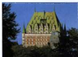
Château Frontenac (siehe S. 134) in Québec