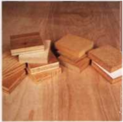
33 Sperrholz und andere Holzwerkstoffplatten