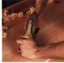
28 Das Putzen mit dem Hobel