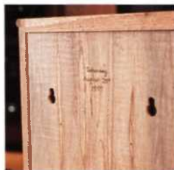
57 Befestigung an der Wand