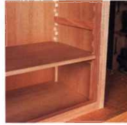
69 Optionen für Regale