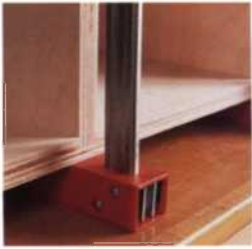
64 Verbindungen für Regale