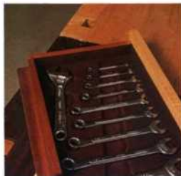
124 Schubladen- einteilungen