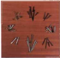
87 Nägel und Schrauben