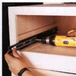
131 Schubladen- führungen