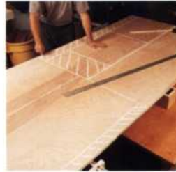
35 Sperrholz anreißen und aufteilen