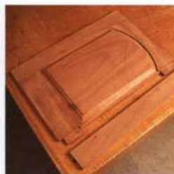
144 Türen aus Rahmen und Füllung