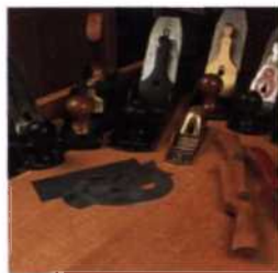
16 Meine liebsten spanenden Werkzeuge