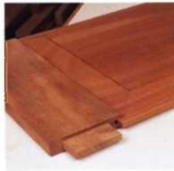
274 Füllungen herstellen