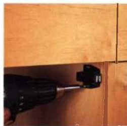
180 Anschläge und Schnäpper