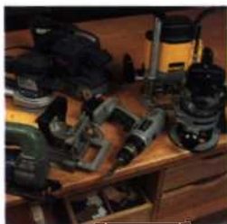
15 Die wichtigsten Elektrowerkzeuge