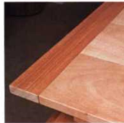
303 Einlegeplatten und Hirnleisten