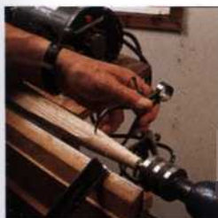
249 Verbindungen im Stuhlbau