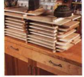
31 Werfen und Verziehen verhindern