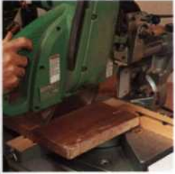
23 Vollholz kaufen und vorbereiten