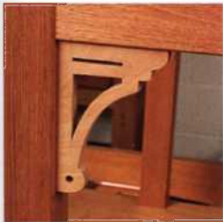
232 Belastbare Verbindungen