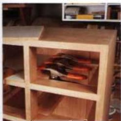
53 Innenteile von Korpusmöbeln