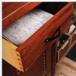
115 Schubladen- konstruktion