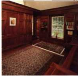
34 Materialien kombinieren