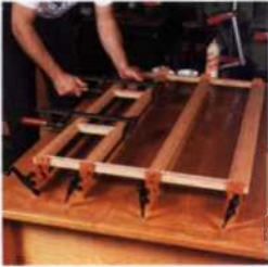
263 Blendrahmen herstellen