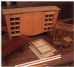
40 Das Arbeiten des Holzes