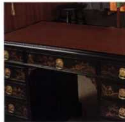
299 Optionen für Tischplatten