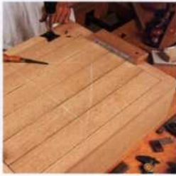
158 Einfache Scharniere einhängen