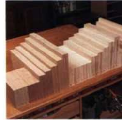
37 Einzelteile kennzeichnen