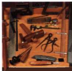
18 Grundlegende Werkzeuge für das Anreißen