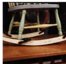
257 Bis zum Fußboden