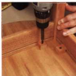
311 Das Arbeiten des Holzes