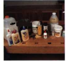
37 Die Auswahl und Verwendung von Klebstoffen