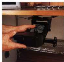
133 Beschläge für Computer