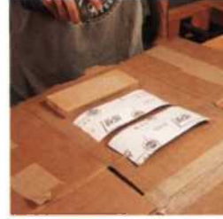
30 Gute Schleiftechniken