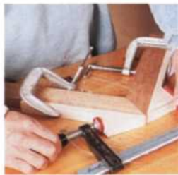
95 Probleme beim Einspannen