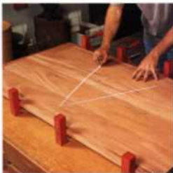
290 Die Konstruktion von Tischplatten