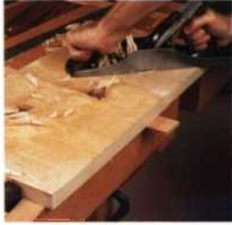
27 Ein Brett mit Handwerkzeug abrichten