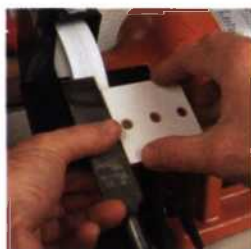
18 Hilfsmittel zum Schärfen