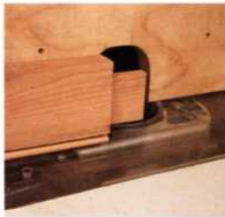
235 Zargen und Friese