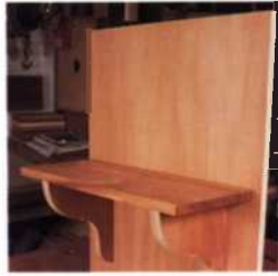
67 Offene Regale