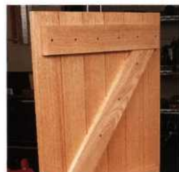
149 Türen aus Vollholz