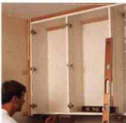
200 Schränke installieren