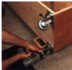
12 Mobilität in der Werkstatt