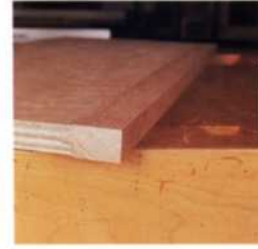
77 Einen Regalboden verschönern