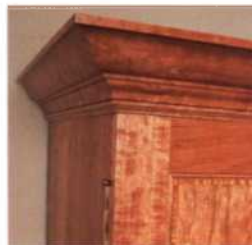
102 Mit Gesimsen arbeiten