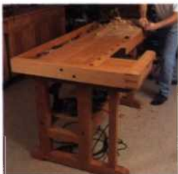
8 Die Grundausstattung der Werkstatt