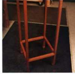
219 Ständer herstellen