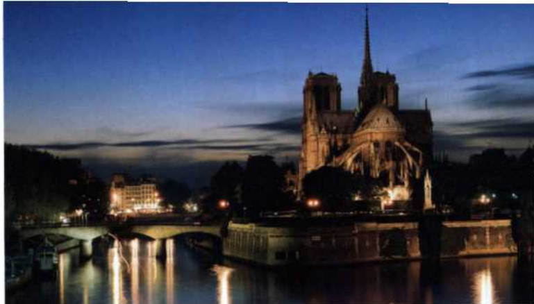
Paris von seiner romantischsten Seite