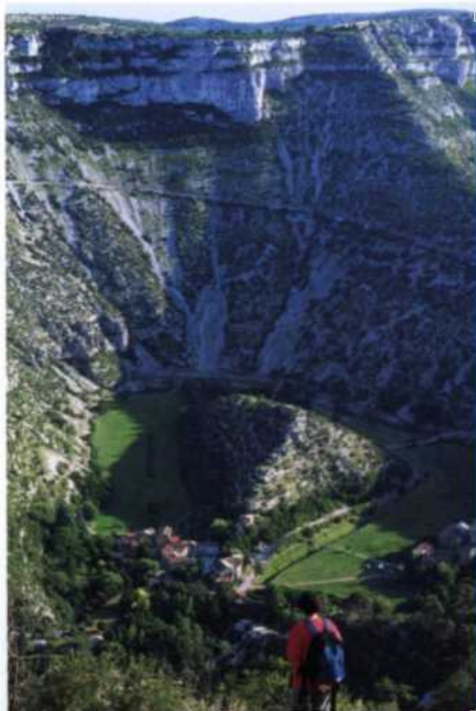
Cirque de Navacelles in den Cevennen