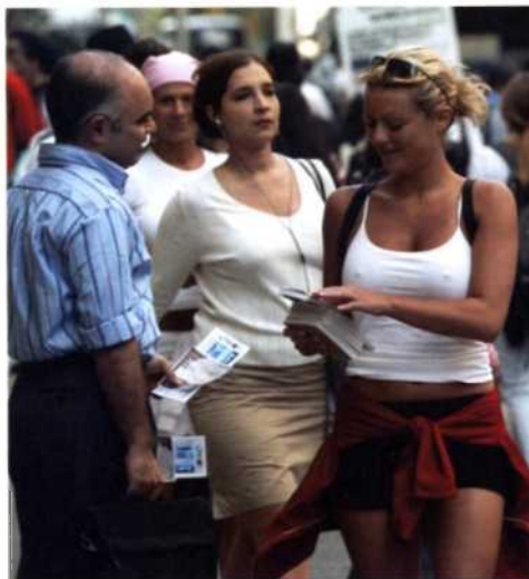
Fifth Avenue, New Yorks Prachtstraße