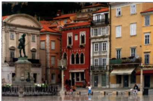
Statue von Giuseppe Tartini auf dem Tartinijev trg, Piran (siehe S. 130f)