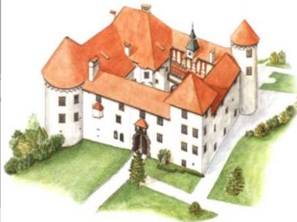
Schloss Wagensberg (siehe S. 90f)