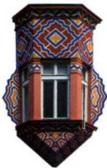
Fassadenbemalung der Genossenschaftsbank, Ljubljana (siehe S. 58)