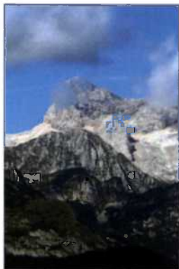
Atemberaubender Blick auf den Gipfel des Triglav (siehe S. 112–115)