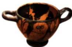
Bemaltes attisches Gefäß, Museum von Tolmin (siehe S. 118)