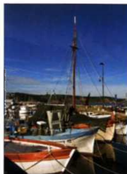
Boote in der malerischen Marina von Izola (siehe S. 133)