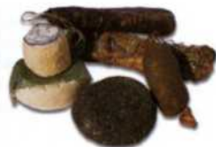
Korsische Delikatessen: Käse und Wurst