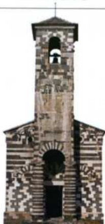
Die romanische Kirche San Michele de Murato (siehe S. 71)