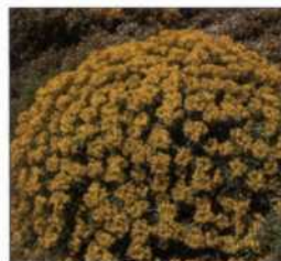
Strahlend gelb blüht die Macchia-Pflanze Euphorbia dendroides