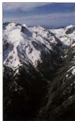
Schneebedeckte Gipfel im Massif des Monte Cinto (siehe S. 23)