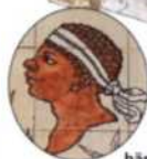
Der »Mohrenkopf« ist das Symbol des unabhängigen Korsika