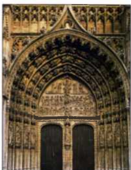
Kunstvolles Tor der Antwerpener Kathedrale (siehe S. 144f)