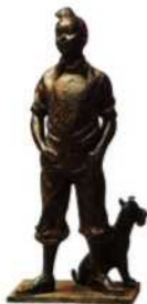
Bronzestatue von Tim und Struppi (siehe S. 24f), Brüssel