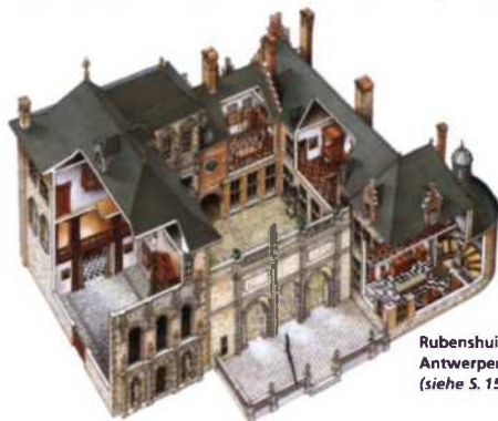
Rubenshuis in Antwerpen (siehe S. 150f)