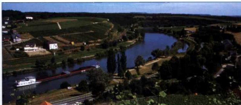
Weinberge im Weinbauzentrum Remich am Ufer der Mosel, Luxemburg (siehe S. 249)