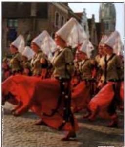
Umzug Praalstoet van de Gouden Boom (siehe S. 33), Brügge