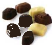
Köstliche belgische Pralinen