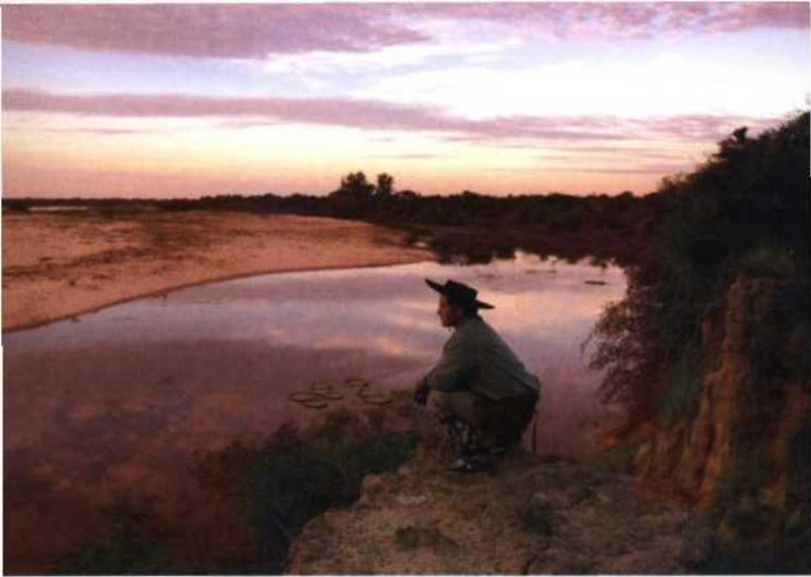
Gaucha am Rio Corrientes, Estancia Buena Vista nahe Esquina