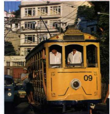
Schiffsverkehr auf dem Amazonas (oben). Die Folklore wird in Brasilien farbenfroh gelebt, hier in Parintins, Amazonas (Mitte). Die berühmte Straßenbahn zuckelte lange durch die Straßen von Santa Teresa in Rio (unten).