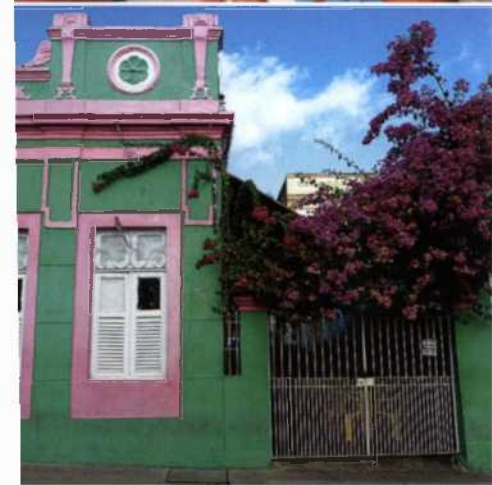
Eine der Ikonen Brasiliens: der Zuckerhut (oben). Brasilianer sind bekannt für ihre Fröhlichkeit (Mitte). Bougainvillea als Kletterpflanze in Recife (unten). Die berühmten Wasserfälle von Iguazu (vorherige Seite).