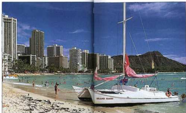
Waikiki Beach mit Diamond Head (siehe S. 62)