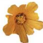
O'ahus offizielle Blume 'Ilima