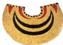
Cape aus Vogelfedern