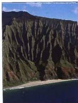
Die stark zerklüftete Na Pali Coast auf Kaua'i (siehe S. 158 und 172)