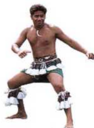
Tänzer im Polynesian Cultural Center, Lā'ie, O'ahu (siehe S. 92)