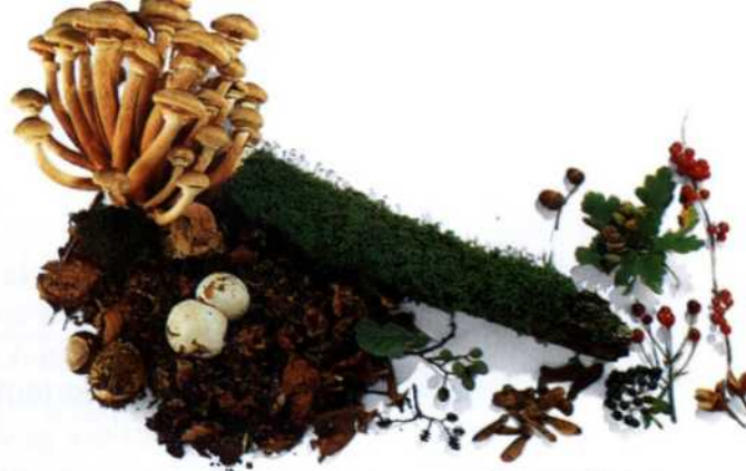
Pflanzen, Pilze und Samen am Laubwaldboden