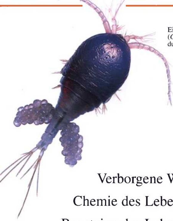
Ein Hüpfertierchen ( Cyclops ) rudert durchs Wasser.