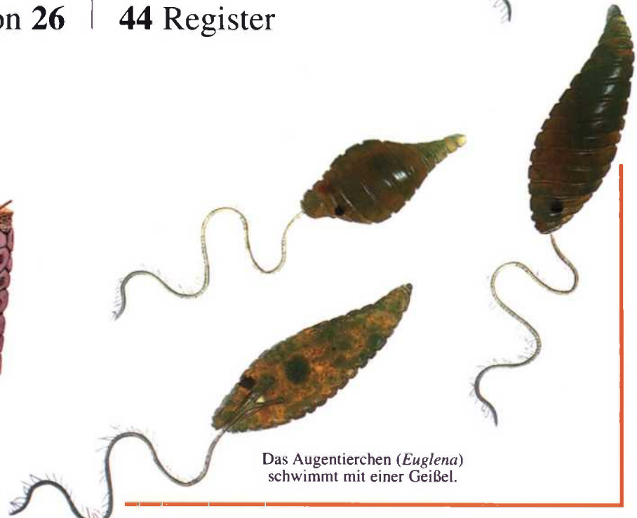
Das Augentierchen ( Euglena ) schwimmt mit einer Geißel.