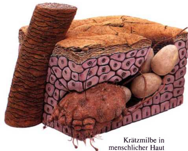
Krätzmilbe in menschlicher Haut