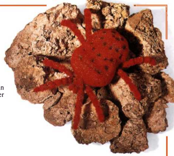
Samtmilbe an einer Mauer