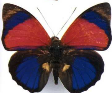
Agrias claudina (Südamerika)