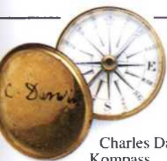
Charles Darwins Kompass