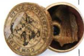
Schmetterlingsflügel aus Darwins Sammlung