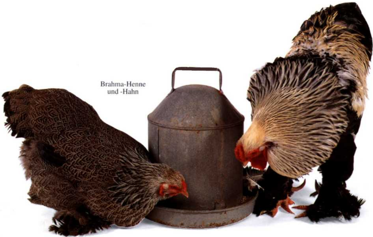
Brahma-Henne und -Hahn

Text von Ned Halley