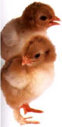
Acht Tage alte Küken