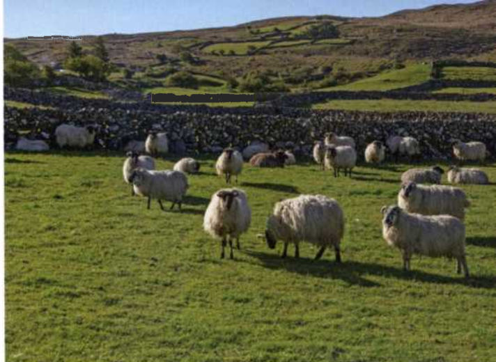
Schafe sieht man oft in Irlands ländlicher Weite