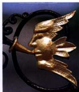
Verzierung am Chorus Gate auf Powerscourt (siehe S. 138f)