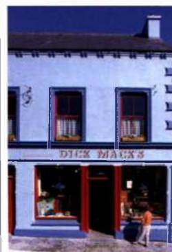
Pub in Dingle (siehe S. 161)

Straßenkarte Hintere Umschlaginnenseiten