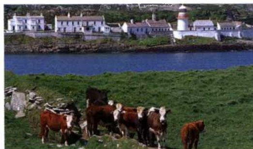
Leuchtturm am Spanish Point bei Mizen Head (siehe S. 171)