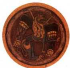
Evangelisches Symbol aus dem Book of Kells (siehe S. 68)