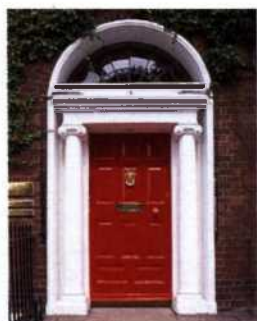
Georgianische Tür am Fitzwilliam Square, Dublin (siehe S. 72)