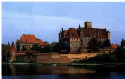
Die Marienburg im Werder ist Welterbestätte der UNESCO (siehe S. 214f)