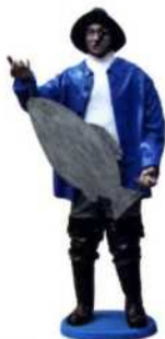
In der Dreistadt laden zahlreiche Lokale zum Fischessen ein