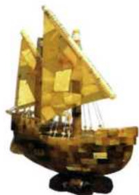
Schiffsmodell aus Bernstein