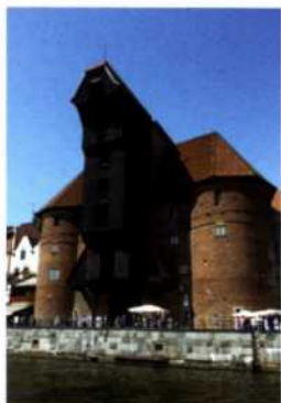
Das Krantor (siehe S. 87) ist das berühmteste Stadttor in Danzig

Die Geschichte Danzigs und Ostpommerns 38