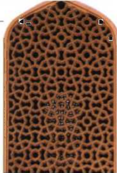
Jali aus Sandstein