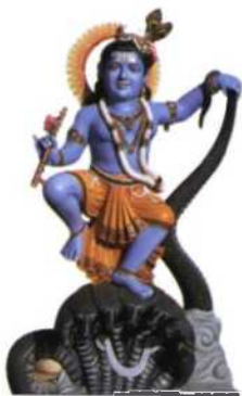
Bildnis des jungen Krishna