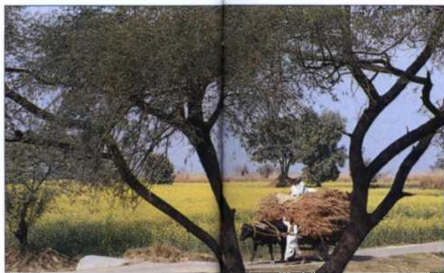
Ochsenkarren vor Senffeldern