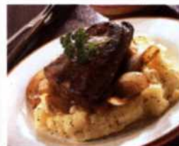
Berliner Leber mit Kartoffelbrei, Zwiebelringen und Apfelscheiben