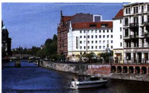
Die Spree fließt auch durch das Nikolaiviertel (siehe S. 90f)