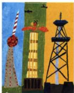
Kinderzeichnung von Fernsehturm, Siegessäule und Funkturm