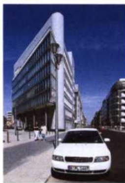
Moderne Architektur beim einstigen Checkpoint Charlie (siehe S. 145)