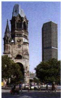
Kaiser-Wilhelm-Gedächtnis-Kirche (siehe S. 156f)