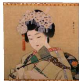
Wandbehang mit Geisha-Motiv, Iakayama (siehe S. 144–146)