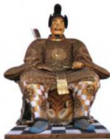
Kaiserfigur am Toshogu-Schrein, Nikko (siehe S. 266f)