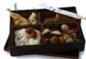
Makonouchi bento, die japanische Lunchbox (siehe S. 325)