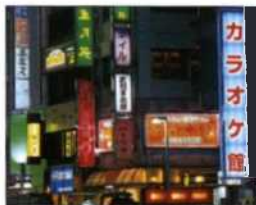
Neonreklame in Roppongi, Tokyo (siehe S. 98f)