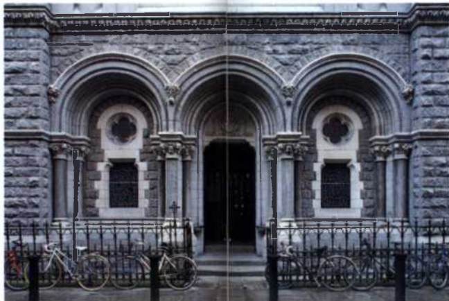
Fassade der St Teresa's Church