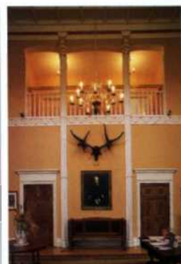
Avondale House (siehe S. 109), in dem Charles Stewart Parnell lebte