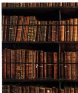
Seltene und wertvolle Bücher in der Marsh's Library (siehe S. 61)

Abstecher 78 Spaziergänge 92 Ausflüge 98