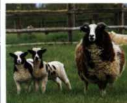
Schafe einer Farm bei Newbridge Demesne, nördlich von Dublin

Nahverkehrsnetz Hintere Umschlaginnenseiten