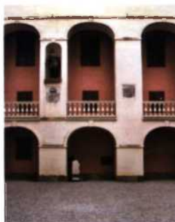
Innenhof des Läckö Slott, Västergötland (siehe S. 224)