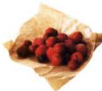
Preiselbeeren sind in Schweden sehr beliebt