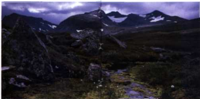
Wollgrasblüte In den Bergen von Sylarna