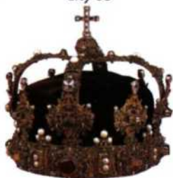
Krone Eriks XIV., Schatzkammer Königliches Schloss, Stockholm