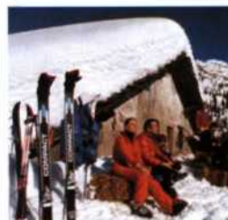
Rast beim Wintersport auf dem Åreskutan (siehe S. 263)