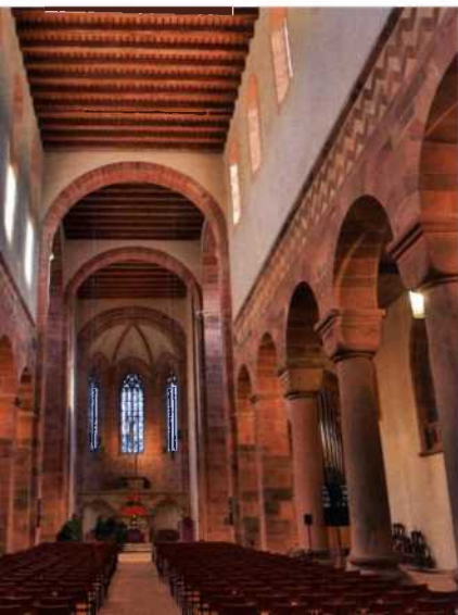
Eine Stätte früher Kultur: Kloster Alpirsbach