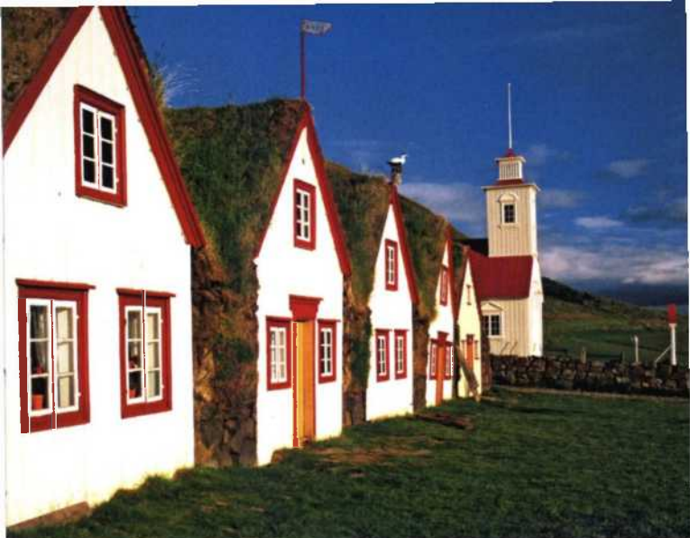
Das Museumsdorf Laufas in Akureyri an der Nordküste