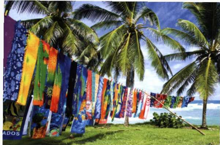
Strandszenerie bei Bathsheba an der Atlantikküste von Barbados