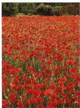
Mohnfeld bei Sisteron (siehe S. 182)