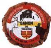
Ziegenkäse in Kastanienblättern