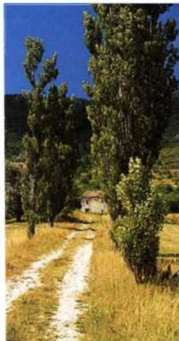
Provenzalische Landschaft zwischen Grasse und Castellane