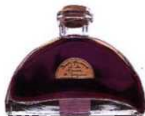
Parfum aus der Provence