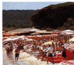
Plage de Pampelonne südlich von St-Tropez (siehe S. 122–126)