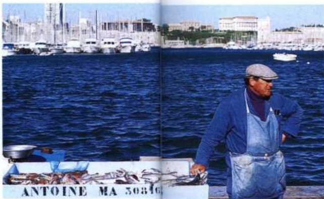
Fischer im Hafen von Marseille