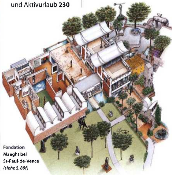
Fondation Maeght bei St-Paul-de-Vence (siehe S. 80f)