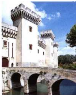
Die Burg Tarascon an der Rhône (siehe S. 144)