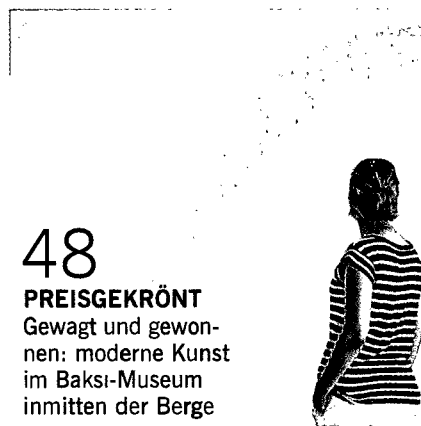
48 PREISGEKRÖNT Gewagt und gewon- nen: moderne Kunst im Baksi-Museum inmitten der Berge