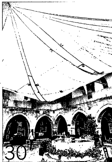
AUFPOLIERT Schmuckstück: die restaurierte Karawanserei »Cinci Han« in Safranbolu