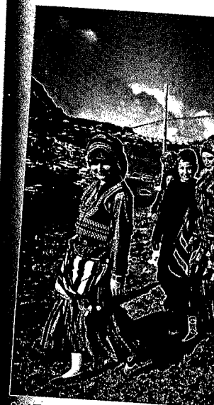
AUFGESTIEGEN In bunten Trachten auf den N Frauen beim Almfest auf dem S