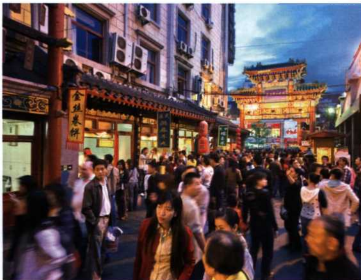
60 PEKING: Der faszinierende Moloch