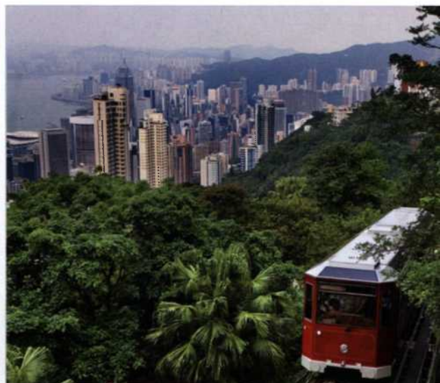
84 HONGKONG: Die schnelle, grüne Metropole