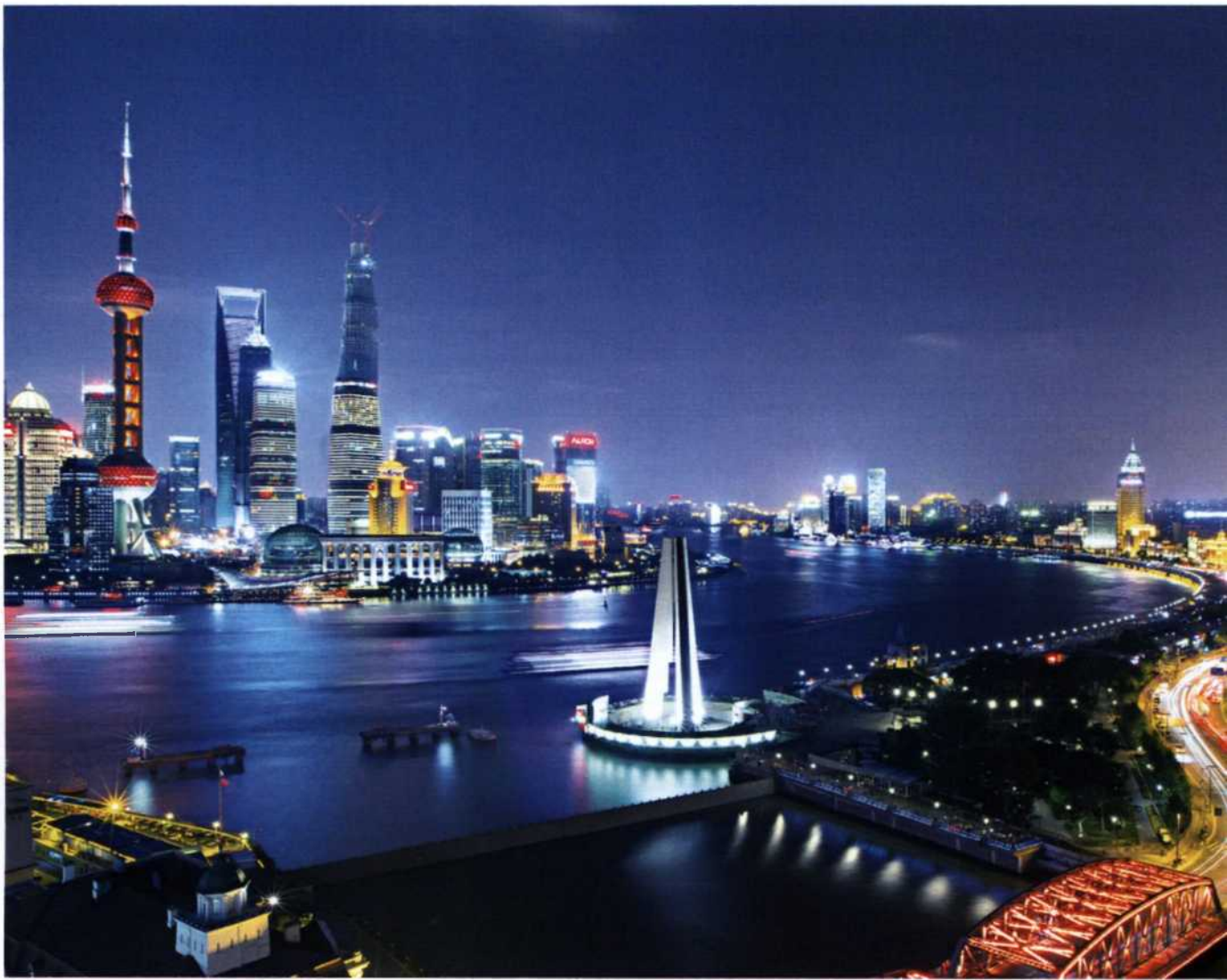
18 SHANGHAI: In der fünftgrößten Metropole der Welt wird die Zukunft jeden Tag neu erfunden