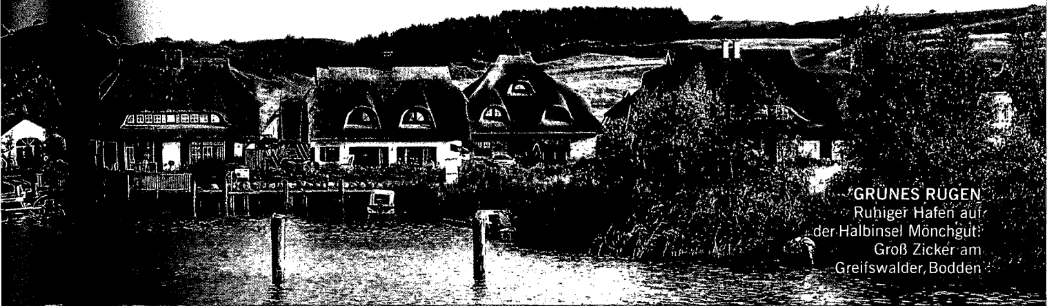
GRÜNES RÜGEN Ruhiger Hafen auf der Halbinsel Mönchgüt: Groß Zicker am Greifswalder Bodden