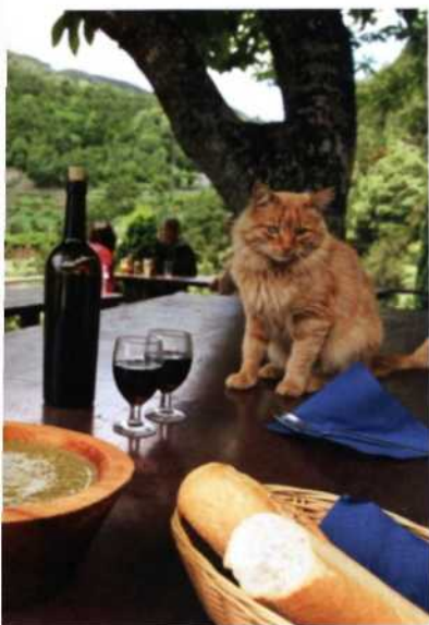
Ob Gofio auch Katzen schmeckt? Restaurant La Vista in El Cedro/ La Gomera