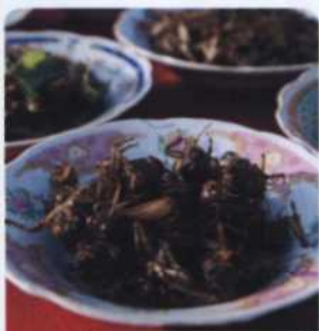
VIENTIANE S. 140