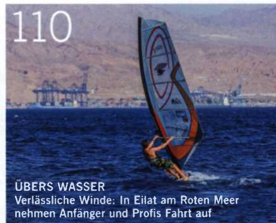
ÜBERS WASSER Verlässliche Winde: In Eilat am Roten Meer nehmen Anfänger und Profis Fahrt auf