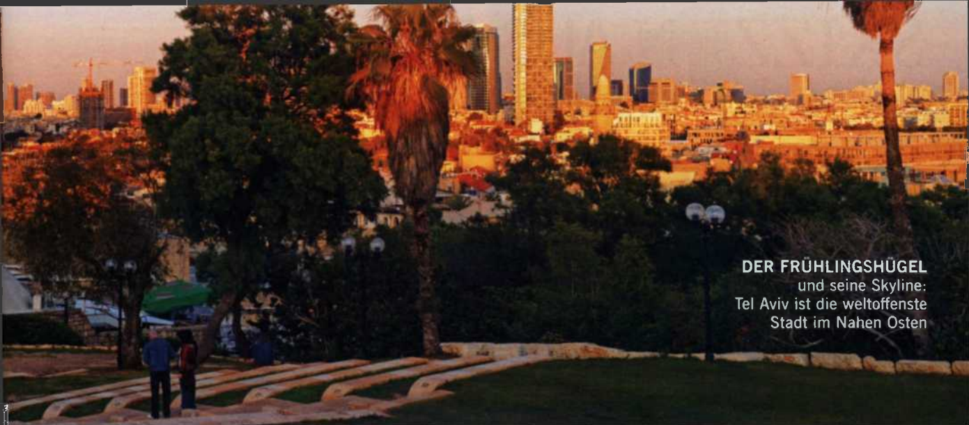
DER FRÜHLINGSHÜGEL und seine Skyline: Tel Aviv ist die weltoffenste Stadt im Nahen Osten