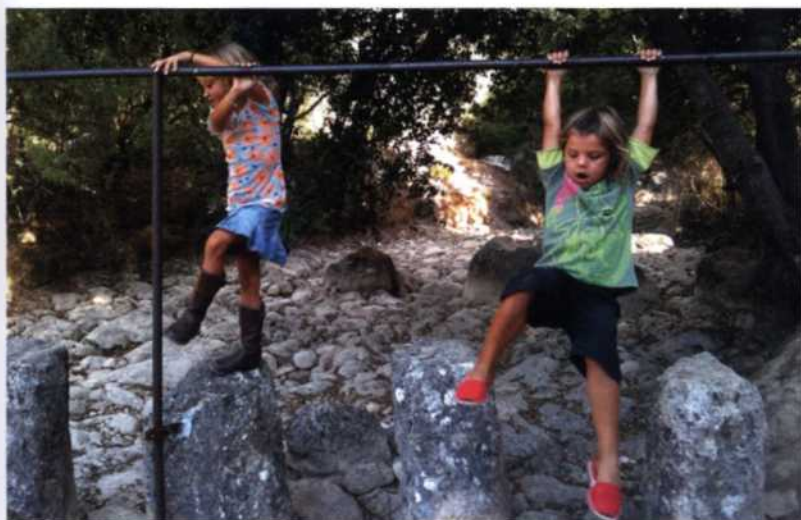
Kleine Kletterübungen im Gebirge sind eine tolle Abwechslung zum Strand.